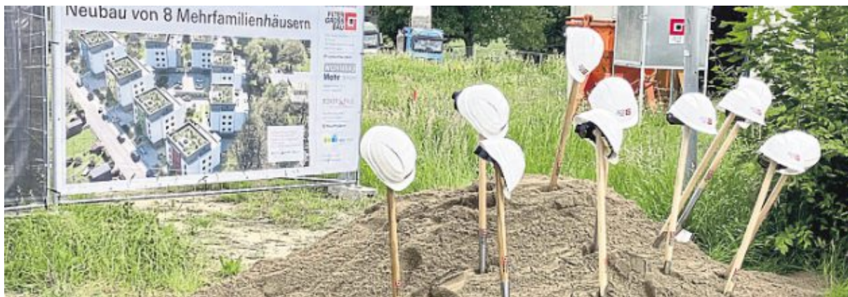
Geduldig warten Spaten und Helme auf ihren feierlichen Einsatz.

Auf dem rund 8000 Quadratmeter großen Areal wird in den kom-