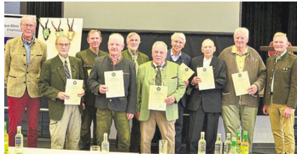
Auf dem Programm der Versammlung der Jäger standen auch zahlreiche Ehrungen.